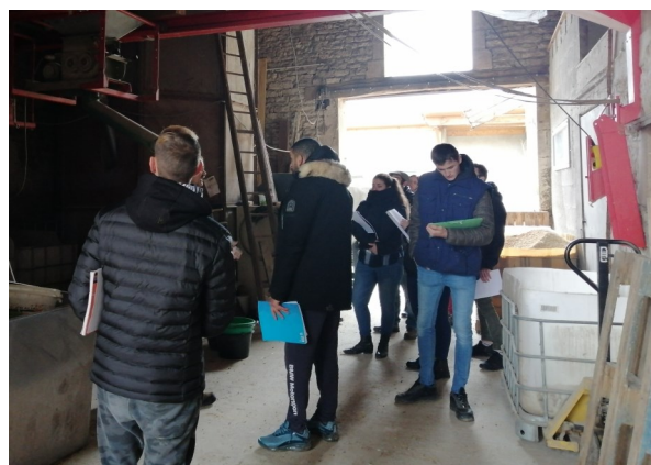
Les élèves du lycée agricole La Barotte écoutent attentivement Gilles (Haute-Marne)