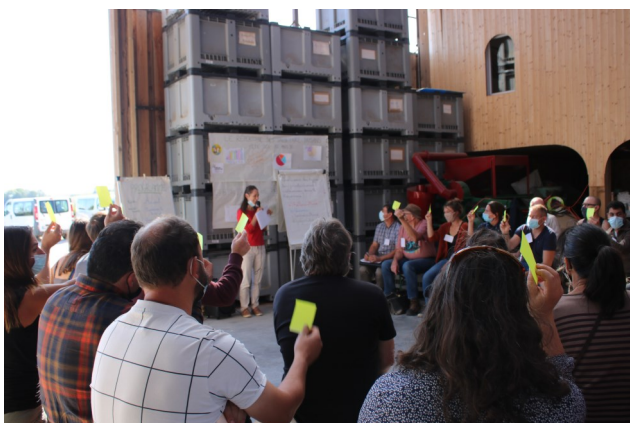
C'est le temps du quizz à la fête du Répertoire (Meuse)

15 nouvelles fiches témoignages vont être publiées prochainement. Vous pourrez découvrir entre autres les témoignages d'une éleveuse de chèvre angora, de producteurs de semences paysannes, ou encore d'un arboriculteur installé en collectif.